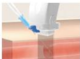
確実な穿刺をアシスト